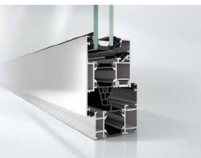
Schüco Окно AWS 60, открывание наружу Schüco Window AWS 60, outward-opening