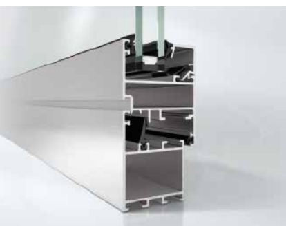
Schüco Окно AWS 50.NI Schüco Window AWS 50.NI