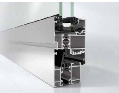
Schüco Окно AWS 50 Schüco Window AWS 50

Окна Schüco представляют собой идеальную комбинацию теплоизолирующих свойств и проверенных системных технологий для удовлетворения потребностей любого рынка. Аллюминиевая оконная система Schüco AWS 50 с открыванием внутрь или наружу представлена в привычном многообразии вариантов, в том числе и для международных рынков.