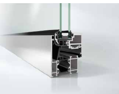
Schüco Окно AWS 60 BS Schüco Window AWS 60 BS

Новое поколение окон Schüco AWS (Aluminium Window System) представляет собой решения, отвечающие разнообразным требованиям. Функциональные преимущества в ней сочетаются с архитектурными и дизайнерскими аспектами, а такие достоинства, как отличная теплоизоляция, дополняются малой монтажной глубиной и изящной шириной видимой части.