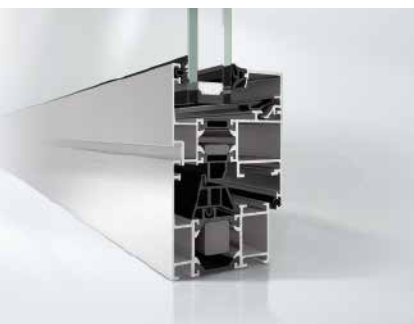
Schüco Окно AWS 60 Schüco Window AWS 60