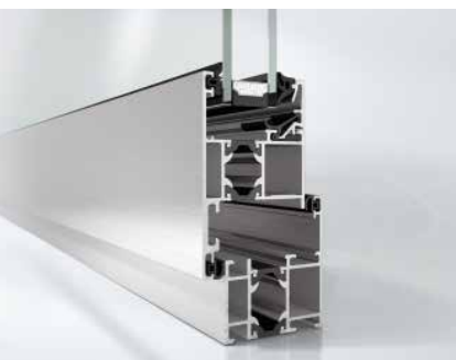
Schüco Окно AWS 50, открывание наружу Schüco Window AWS 50, outward-opening

Schüco windows offer the correct combination of thermal insulation and tried-and-tested system technology for every market. Whether it is for inward or outward-opening windows, AWS 50 from Schüco also provides international markets with aluminium windows from Schüco in their customary range of solutions.