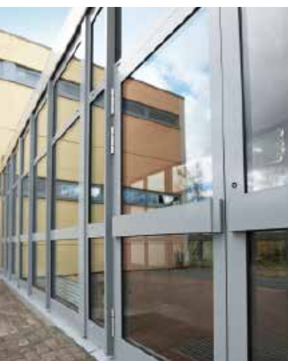
Алюминиевая дверная система Schüco ADS 50.NI Schüco Aluminium door system ADS 50.NI

Алюминиевая дверная система Aluminium Door System