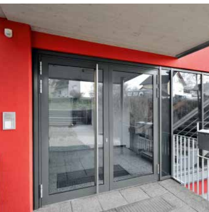
Алюминиевая дверная система Schüco ADS 70 HD Schüco Aluminium door system ADS 70 HD

Алюминиевая дверная система Aluminium Door System