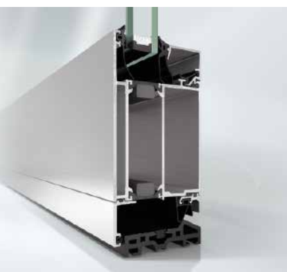
Schüco Дверь ADS 70 HD Schüco door ADS 70 HD