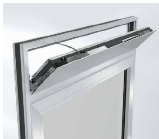
Вентиляционная створка AWS VV с фурнитурой TipTronic в виде откидной фрамуги или поворотного решения The AWS VV ventilation vents with TipTronic fittings are available as bottom-hung "toplight" and side-hung solutions

Вентиляционные створки Schüco AWS VV (Ventilation Vent) поставляются в виде непрозрачных поворотных элементов открывания шириной 300 мм, 250 мм и 170 мм. Широкий ассортимент системных профилей с монтажной глубиной от 65 мм до 90 мм позволяет гибко применять решения Schüco для проветривания. Поворотные створки высотой от пола до потолка обеспечивают удобное проветривание помещений и разнообразные возможности для архитектурного оформления. В летний период поворотные створки могут длительное время находиться в открытом положении. Вентиляционные створки удобны в использовании и идеально подходят для комбинации с большими остекленными и глухими элементами.