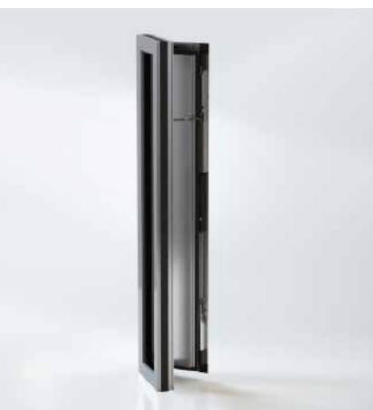
Решение вентиляционной створки высотой от пола до потолка Floor-to-ceiling ventilation vents are possible.