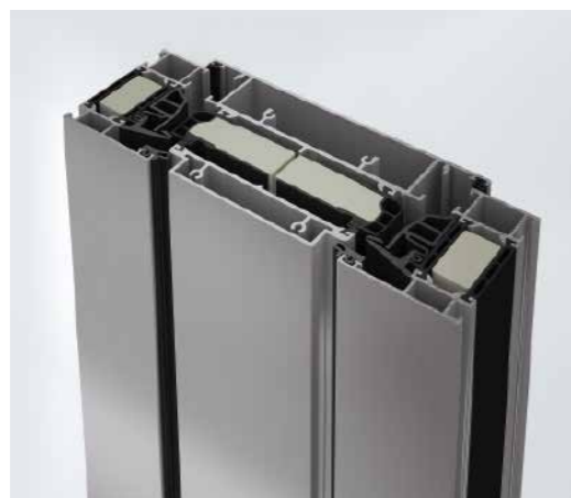
Горизонтальное сечение вентиляционной створки Horizontal section detail through the ventilation vent